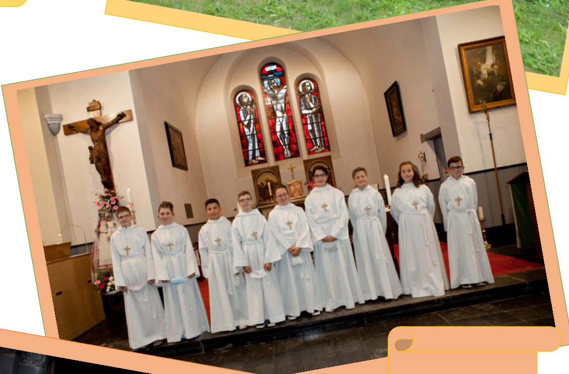
Professions de foi à Morhet